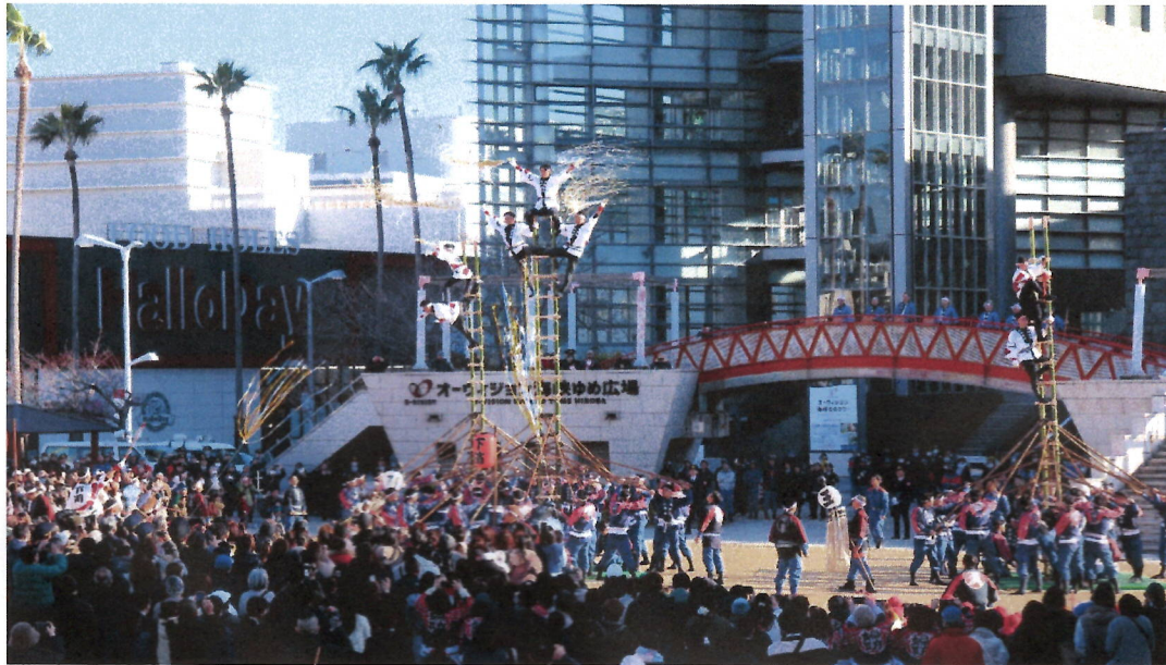
オーヴィジョン海峡ゆめ広場